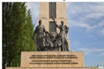
Памятная стела, посвященная героям Великой Отечественной войны

Тема нашей газеты выбрана не случайно. 2025 год с России объявлен годом защитников отечества, поэтому мы решили рассказать в этом выпуске о некоторых памятниках которые расположены в нашем городе.